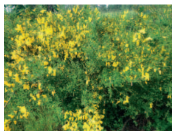
Janovec metlatý – na Líšnici roste například mezi greeny č. 2 a 4 nebo mezi jamkami č. 5 a 8

Janovec metlatý ( Cytisus scoparius ) je keř se zelenými hranatými větvemi, ze kterých střídavě vyrůstají malé trojčetné listy. Dorůstá výšky 0,5 až 2,5 metru. V horních částech větví vyrůstají v paždí listů jednotlivé žluté květy. Kvete v květnu až v červnu. Plodem je tmavý ochlupený luska. Celá rostlina je jedovatá.