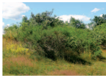
Mezi jamkami č. 5 a 8

k urychlení hry, jelikož málokdo se zde obtěžuje míček hledat.