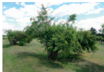
Jamka č. 7 vpravo

Mezi fervejemi č. 1 a 4 máme hezké strofořadí. Na jeho konci je zcela nesmyslně několik keřů, jejichž funkce mi zcela uniká. Zde bych křoví úplně zrušil. Další takové místo je na ferveji č. 7 cca 130 metrů před greenem po pravé straně. Je zde nevzhledné pichlavé křoví. Jestli je potřeba tam něco mít, pak si myslím, že několik stromků by bylo vhodnější volbou.