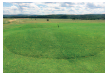
Boule pro trénink hry z nakloněných pozic na líšnickém drivingu

První situací, kterou se budeme v tomto dílu zabývat, bude hra míče ve svahu nad hráčem.