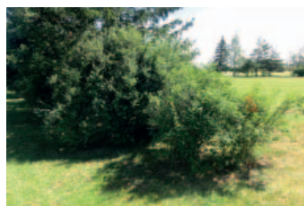
Mezi jamkami č. 1 a 9

Takové keře máme třeba mezi fervejemi č. 1 a 9 nebo 7 a 9. Obecně bych je nechal, ovšem v typických dopadových oblastech bych je nahradil stromy, pod nimiž hráči najdou míček mnohem rychleji (viz prostor mezi jamkami č. 1 a 4, kde míček ztratíte dost obtížně). Vykácet pár keřů i mezi 1 a 9 by přispělo k plynulosti hry.